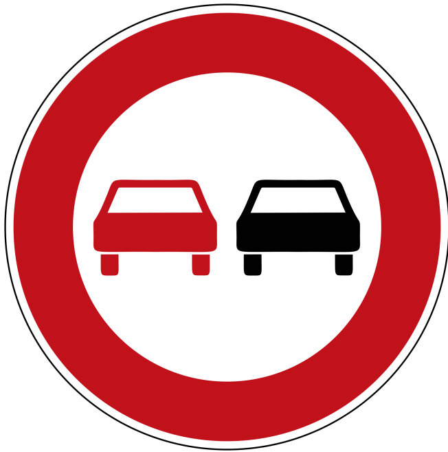
Rund und rot ist ein Verbot